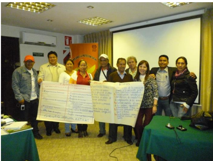
Trabajo de grupos: Taller nacional de intercambio de experiencia. La Paz Bolivia (10- 11 de diciembre de 2014)