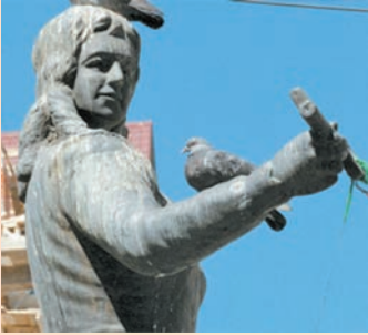
Vicenta Juaristi Eguino

Nació el 3 de abril de 1785, falleció en marzo de 1857. Luchó por la independencia de nuestro país. Es considerada la primera mujer heroína de la República y protagonista importante en la lucha por la independencia, mujer de temple y carácter indomable, nunca le importó arriesgar su vida para luchar por la libertad.