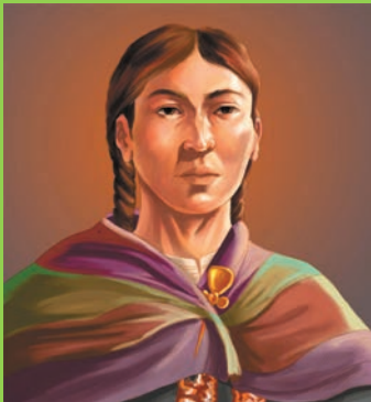
Guerrera aymara boliviana

Conozcamos algunas mujeres que pese a los prejuicios de una sociedad autoritaria y machista pudieron sobresalir en distintos campos.